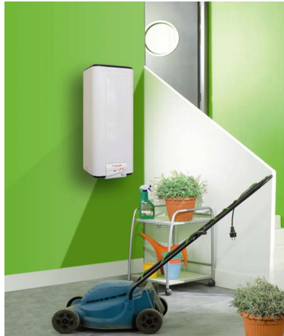
VM 30L - 50L