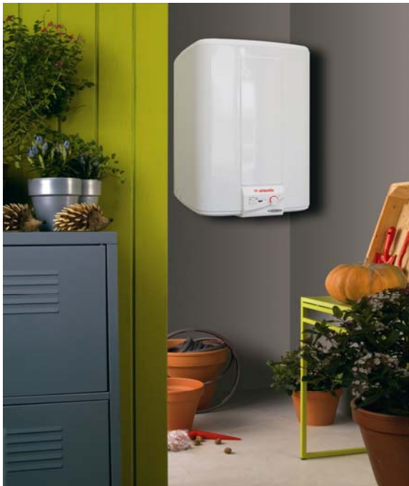
VM 75L - 100L - 150L