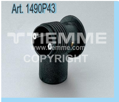
Box in plastica per guaina W23 e W27 Plastic box for W23 and W27 sheath