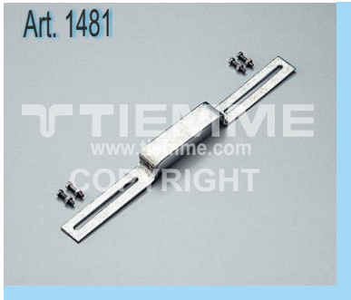
Staffa per curve flangiate Art. 1406 Bracket for wallplate elbow Art. 1406