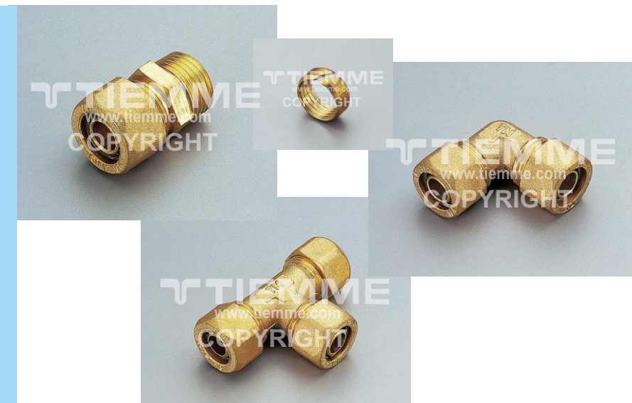
Per la gamma completa vedere il catalogo / For complete range see catalogue

The compression fittings with brass ring for Pe-X pipe are suitable for domestic and commercial plumbing, industrial and agricultural application, heating and sanitary system, pneumatic systems, natural gas, oils and generally with every non aggressive fluid.