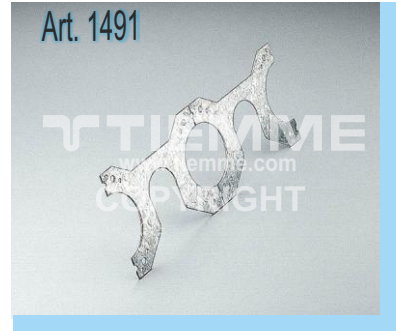
Staffa doppia frazionabile Double divisible bracket